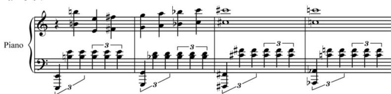
Nümunə № 1

Aşıqlərin leytmotivi (Əmir Əhmədin leytmotivi) böyük seksta (ton yarımton hərəkəti) üzərində ifadəli yüksələn motivə əsaslanır. Bu motivinin mis nəfəs alətlərinin intensiv müşayiəti fonunda simlilərdəki “uçuş” hərəkəti aşıqlərin kədərli taleyini aydın şəkildə çatdırır – onların birlikdə olmaq arzusunun poetik uçuşunu, nəsrin “qayalarına” çırpılmasını ifadə edir. (Nümunə № 1)