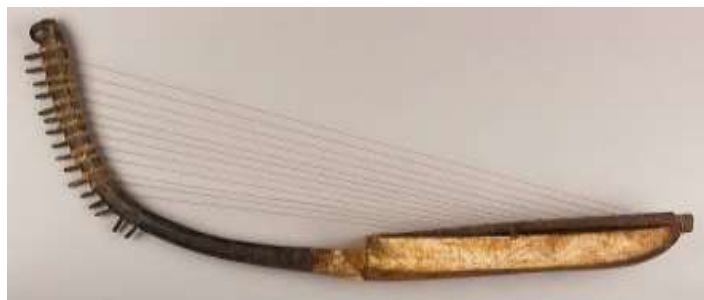
Арфа (Древний Египет, период Нового Царства). 1390-1295 до н.э.