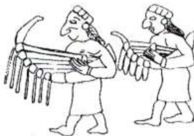
Шумерский барельеф из древнего города Адабе (3000 до н.э.)