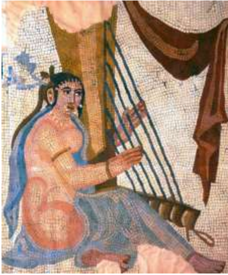
Напольная мозаика из раскопок Бишапура. 260 г. н. э. (Лувр, Париж)