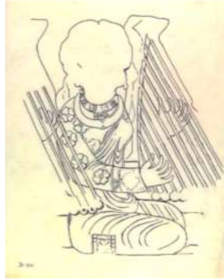
Рисунок с барельефа Так-е Бостан (приблизительно 4 век н.э.)

Исходя из вышесказанного, первоначально персидские арфы не имели ярко выраженной округлой формы верхней деки, поэтому есть некоторое несоответствие с названием «коготь». Да и образная концепция не имеет универсальное значение и может отличаться исходя из восприятия каждого человека (процесс формирования субъективного образа целостного предмета изучает раздел психологии – психология восприятия). К примеру, поэт Хафиз сравнивал форму ченга с образом старика, а Манучехри Дамгани с лошастью с поднятой головой и опущенной гривой (18).