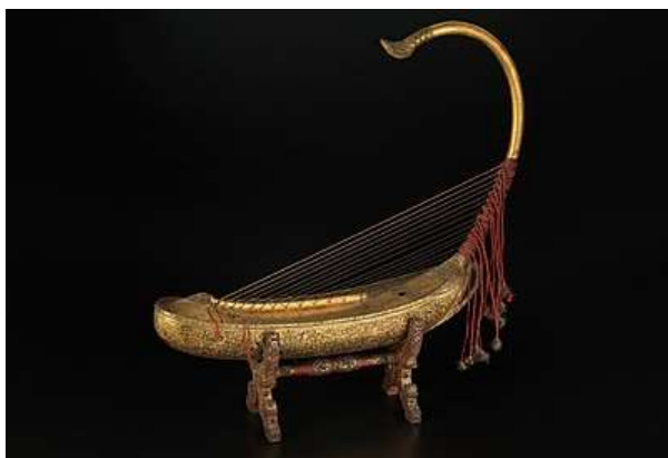
Бирманский saung gauk XIX века